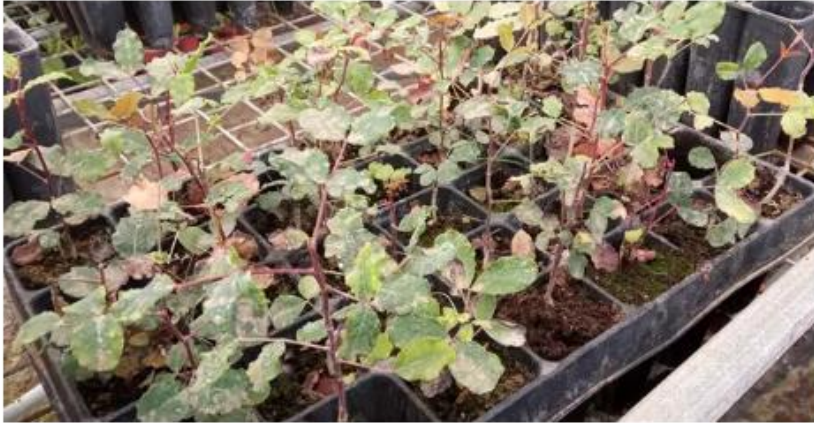
Plantales de algarrobo.